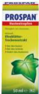
Prospan® Hustertropfen Flüssigkeit zum Einnehmen, 50 ml*