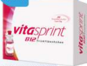
Vitasprint B12 Trinkfläschchen, 30 Stück*