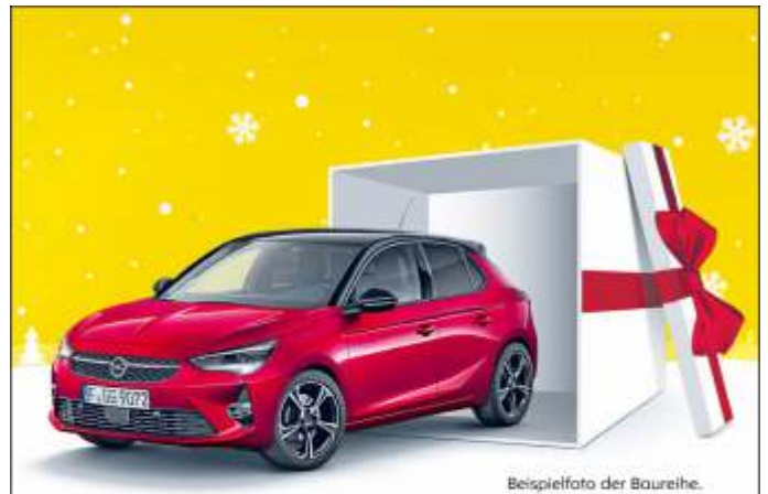
Beispielfoto der Baureihe.

Hauptstraße 15 • 86706 Lichtenau • Tel. 08450-210 info@elektro-greiner.de