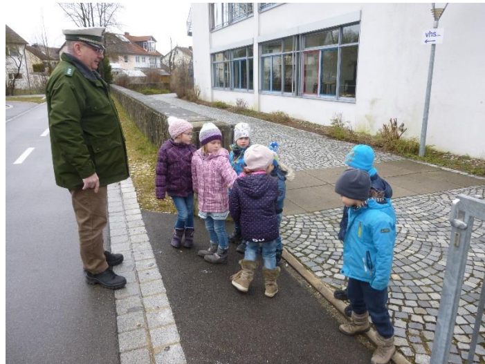
Besuch im Verkehrsgarten