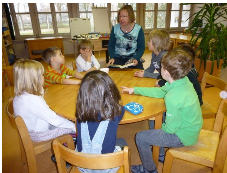
Besuch der Erstklasslehrerin