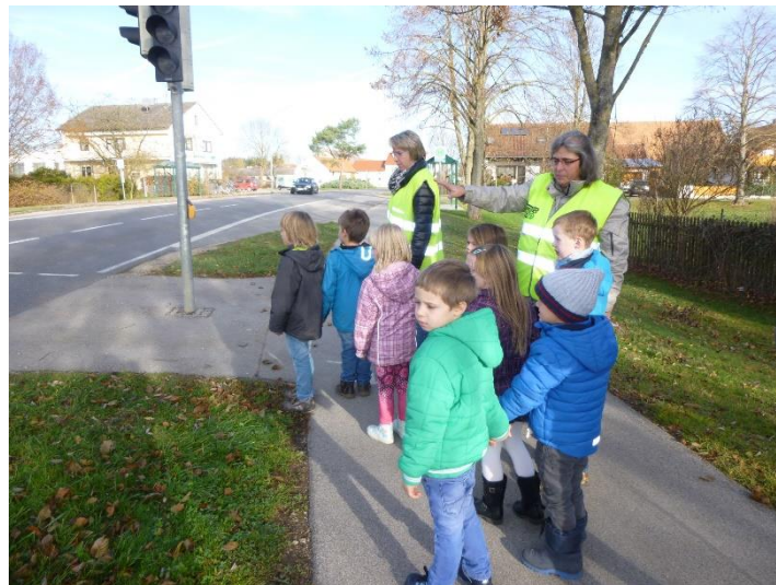
Besuch der Schulweghelfer