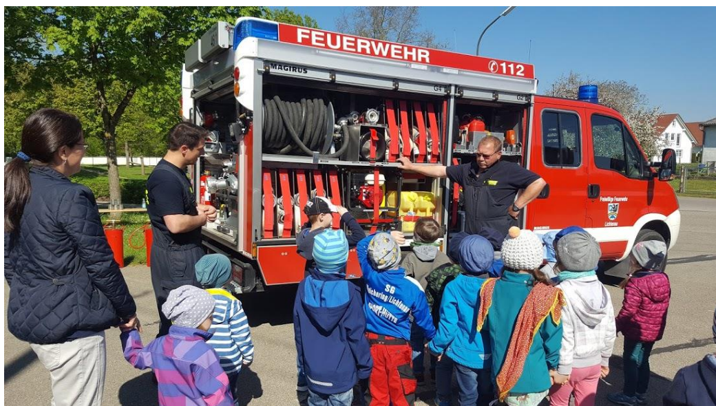
Besuch bei der Lichtenauer Feuerwehr