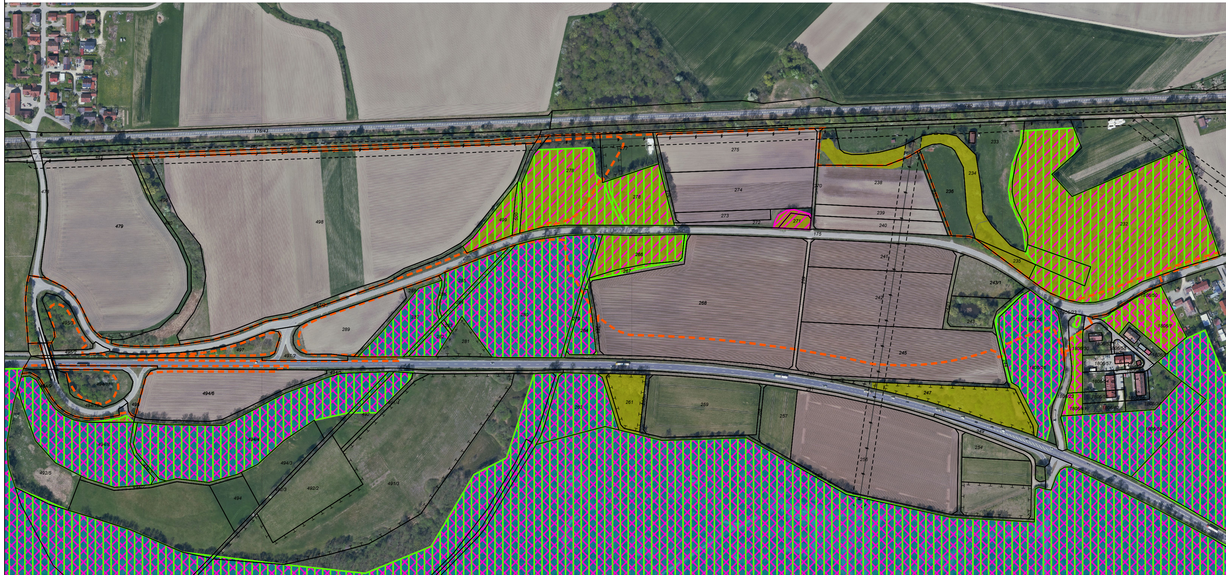
Waldrechtlicher Bestand, Waldfunktionen gemäß Waldfunktionsplan