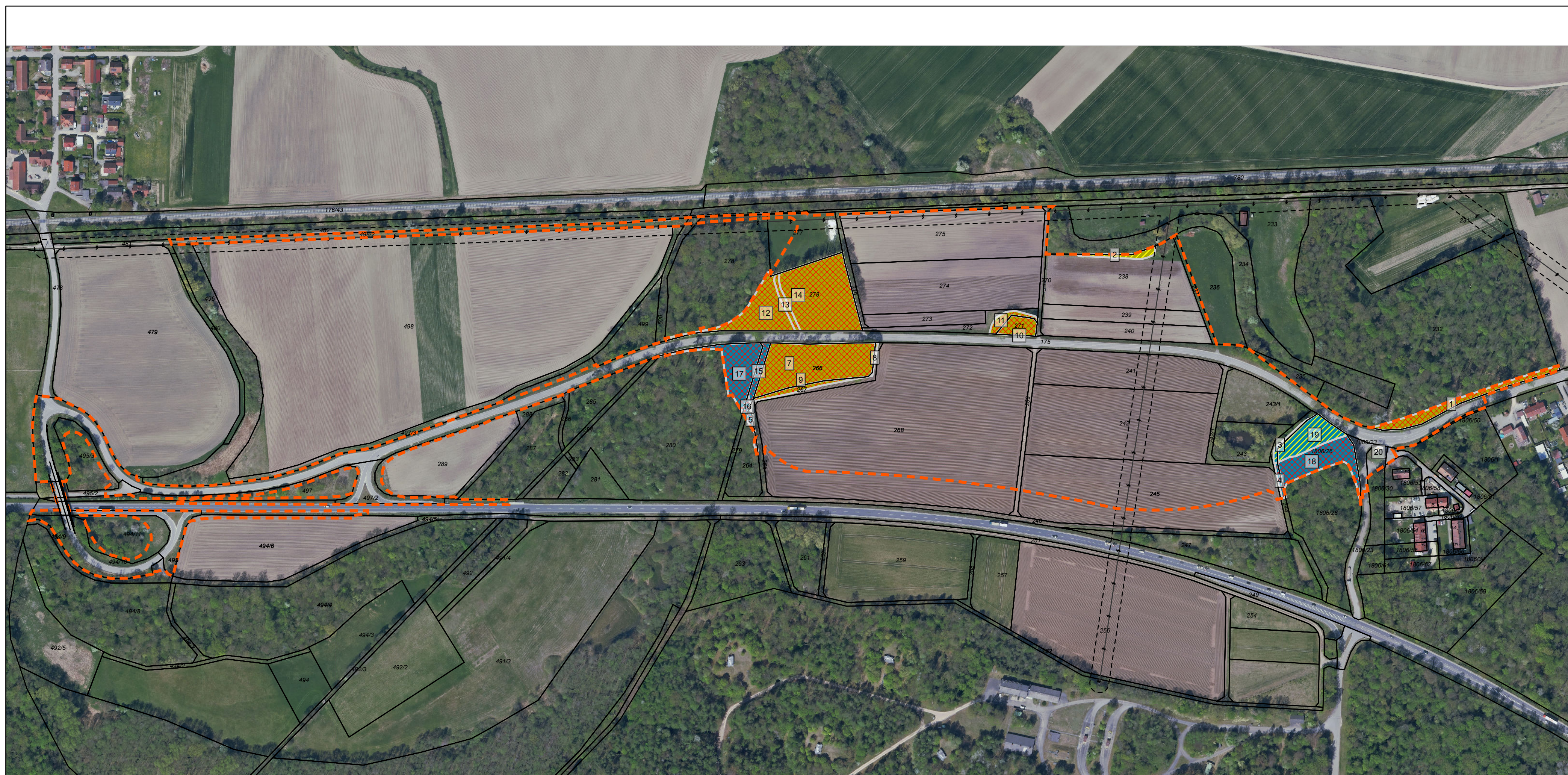
Ermittlung der betroffenen Waldflächen - vgl. Anhang Nachweis waldrechtliche Flächenbilanz